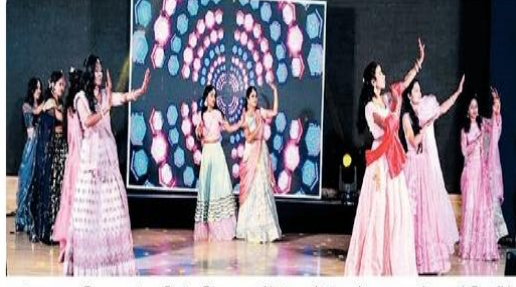
दयानंद कला महाविद्यालयात फॅशन डिझाईन विभागाच्या वतीने मंगळवारी फॅशन शो झाला. यामध्ये सहभागी विद्यार्थिनी.

Hello Latur Page No. 2 Mar 01, 2023 Powered by: erelego.com