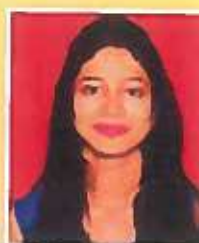
कु. स्वामी गौरी बिरभद्र एम.ए. फॅशन विद्यापीठात तृतीय