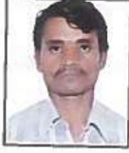
कु. लागले एन.एम. (सेवक)